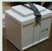
大容量144Ahリチウム イオンバッテリー ¥300,000-/ラインOP ※2