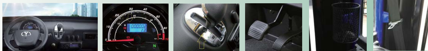
シンプル&スタイリッシュ インストゥルメントパネル