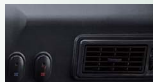
エアコン&ブロー ¥95,000-/ラインOP ※1