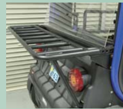
リヤキャリア ¥48,000-/販売店 ※3