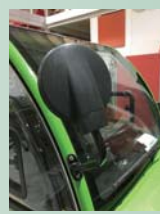
丸型アウトミラー ¥3,000-/販売店